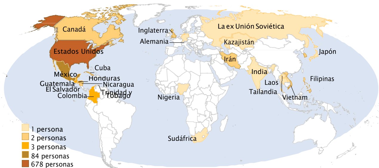
Figura 1. Lugar de nacimiento de las personas afectadas por las leyes de criminalización del VIH en California (enero de 1988 a junio de 2014)

En total, poco más de la mitad de todos los incidentes de aplicación de las leyes relacionadas con el VIH se produjo en el condado de Los Ángeles. Esto fue así tanto para personas nacidas en el extranjero (59%) como para personas nacidas en EE.UU. (56%). No surgió ningún patrón significativo en términos de relaciones entre el estado de inmigración, la aplicación de leyes relacionadas con el VIH y las proporciones de inmigrantes entre los condados. (Consulte la Tabla 3). Por ejemplo, el 10% de los incidentes de aplicación de leyes relacionadas con el VIH contra personas nacidas en EE.UU. se produjo en el condado de Sacramento, mientras que allí solo se produjo el 3% de los incidentes de aplicación de leyes relacionadas con el VIH contra personas nacidas en el extranjero. Por otra parte, el 4% de los incidentes de aplicación de leyes relacionadas con el VIH contra personas nacidas en EE.UU. se produjo en el condado de Orange, mientras que allí se produjo el 7% de los incidentes contra sus pares nacidos en el extranjero.